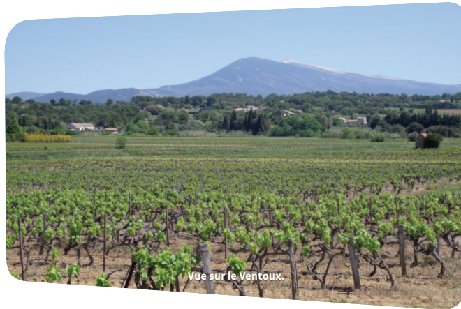
Vue sur le Ventoux.

VENTOUX-PROVENCE Expériences aux sommets