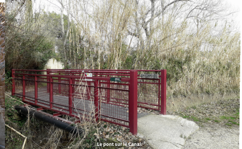
Le pont sur le Canal.

Balisage : Petits panonceaux de bois portant l'inscription QVG, peinte à la peinture rouge. Ref carte IGN : TOP25 3040ET : Carpentras / Vaison-la-Romaine / Dentelles de Montmirail