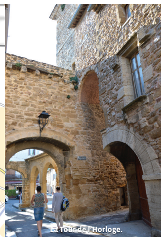
La Tour de l'Horloge.