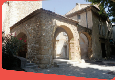
La chapelle Saint-Sixte.

La chapelle Saint-Sixte , édifice roman mentionné dès le 11 e siècle. Cet ancien monastère restauré abrite aujourd'hui un caveau de dégustation de vins au cœur d'un domaine de 64 ha.