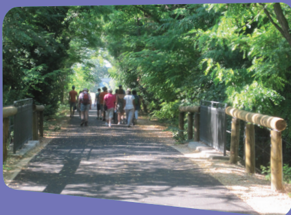
La voie verte Via Venaissia Carpentras-Sarrians.

Louer un vélo vintage à Loriol du Comtat pour parcourir les 15 km de la Via Venaissia, voie verte qui emprunte l'ancienne voie ferrée entre Carpentras et Orange et qui traverse de beaux paysages de vergers et de vignobles au cœur de la plaine agricole du Comtat Venaissin . Plusieurs accès possibles à partir de Carpentras, Loriol du Comtat, Sarrians ou Jonquières.