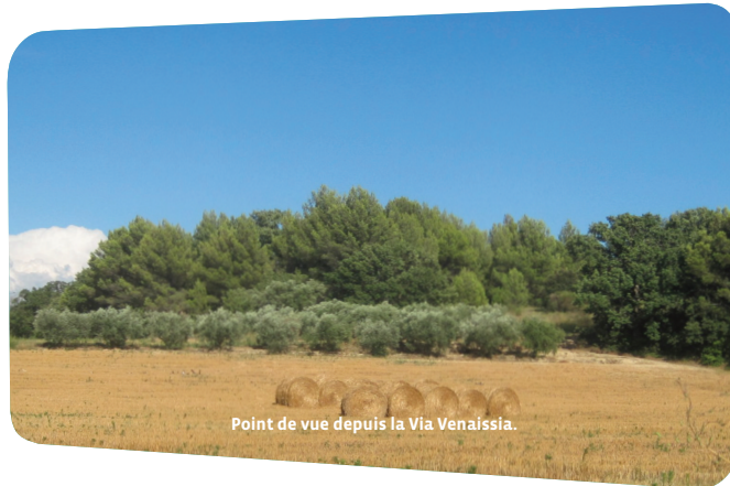
Point de vue depuis la Via Venaissia.

Dégustation au Domaine Fontaine du Clos .